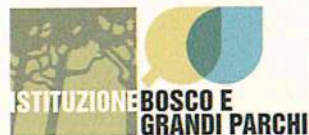
Tavola allegata all'Ordinanza n° 611 del 10/08/2015